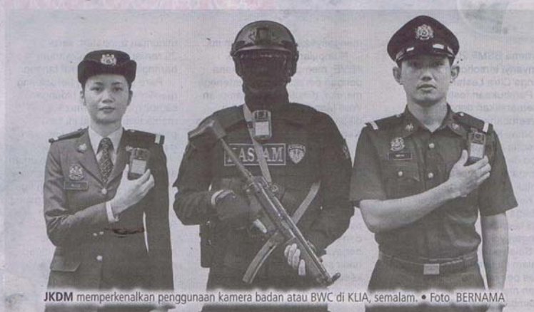
JKDM memperkenalkan penggunaan kamera badan atau BWC di KLIA, semalam.

"Hal ini membuktikan keberkesanan penggunaan BWC dalam kalangan pegawai JKDM di lapangan dan secara tidak langsung meningkatkan tahap integriti pasukan," katanya ketika berucap pada majlis pelancaran BWC di Bangunan AMC (Lapangan Terbang Antarabangsa